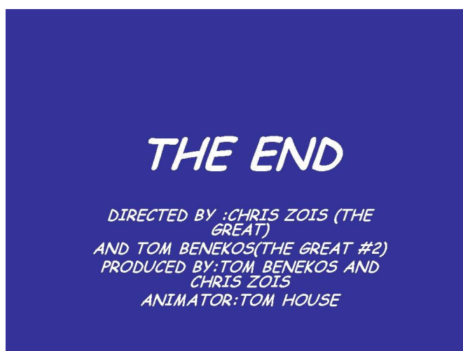
Σχήμα 7. Τίτλοι τέλους στα αγγλικά