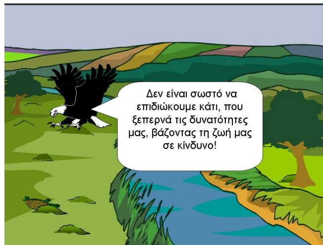
Σχήμα 8. Από το μύθο ‘χελώνα και αητός’