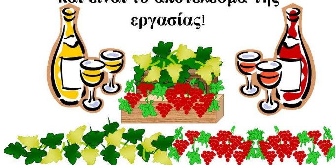
Σχήμα 11. Από το μύθο 'ο θησαυρός στο αμπέλι'

Έτσι κατάλαβαν ότι ο θησαυρός βρίσκεται στα χέρια τους και είναι το αποτέλεσμα της εργασίας!