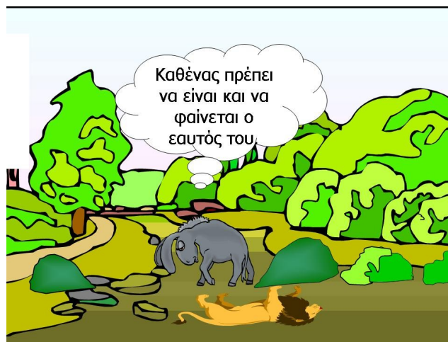
Σχήμα 9. Από το μύθο ‘ο γάιδαρος που παρίστανε το λιοντάρι’