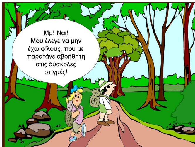
Σχήμα 10. Από το μύθο 'οι δυο φίλοι και η αρκούδα'

Έτσι κατάλαβαν ότι ο θησαυρός βρίσκεται στα χέρια τους και είναι το αποτέλεσμα της εργασίας!