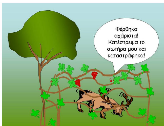
Σχήμα 12. Από το μύθο 'το αχάριστο ελάφι'