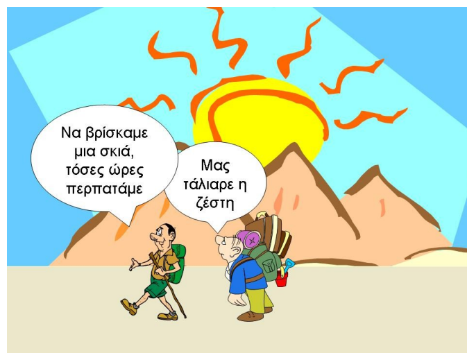
Σχήμα 5. Διάλογος με ιδιοματική γλώσσα