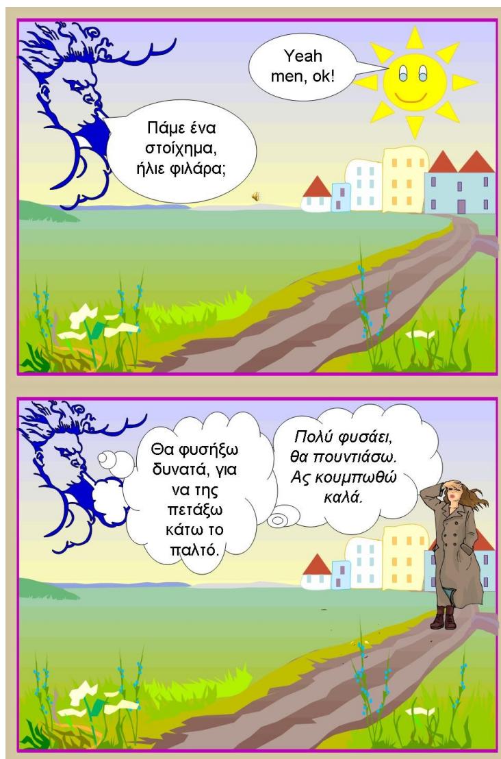
Σχήμα 15. Σχεδίαση από τα κορίτσια, διάλογοι από τα αγόρια