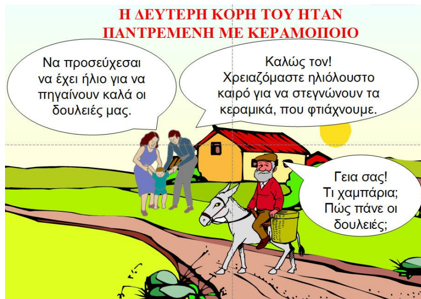
Σχήμα 2. Παράδειγμα συνεργασίας από το μύθο ‘ήλιος ή βροχή’