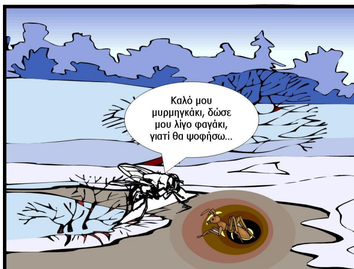
Σχήμα 14. Έκφραση κοριτσιών από το μύθο ‘Μυρμήγκι και τζίτζικι’