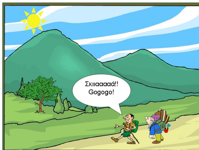
Σχήμα 6. Επιφώνημα στα αγγλικά