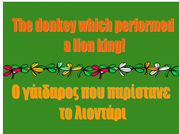
Σχήμα 3. Δίγλωσσος τίτλος μύθου