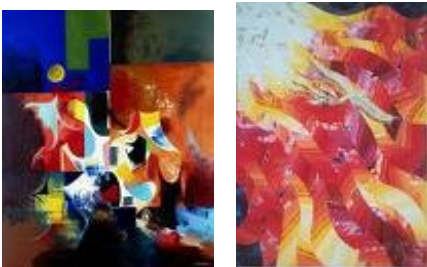
The Pentecost- oil canvas by Alexander Sadoyan, Armenia and by Solomon Raj, India

Ιδιαίτερα σημαντική ήταν η προσπάθεια των μαθητών να ανακαλύψουν παραδόσεις άλλων λαών που ζουν ως μετανάστες στην Ευρώπη. Εικόνες από την Αρμενία, την Ινδία ή το Σουδάν ήταν μέρος των εικόνων που χρησιμοποιήθηκαν από μαθητές και εκπαιδευτικούς για την προσέγγιση των μειονοτικών πληθυσμών.